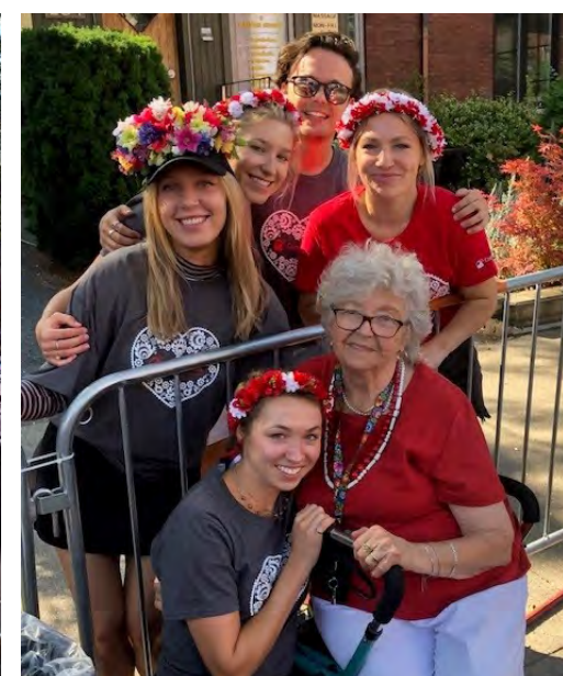
Good times and good food were the order of the day at the Copernicus Lodge Food & Beverage Garden thanks to our many volunteers!